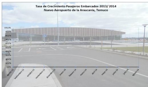
Gráfico 1: Tasa de Crecimiento últimos 12 meses Fuente: Dirección General de Aeronáutica Civil

Fuente: Dirección General de Aeronáutica Civil